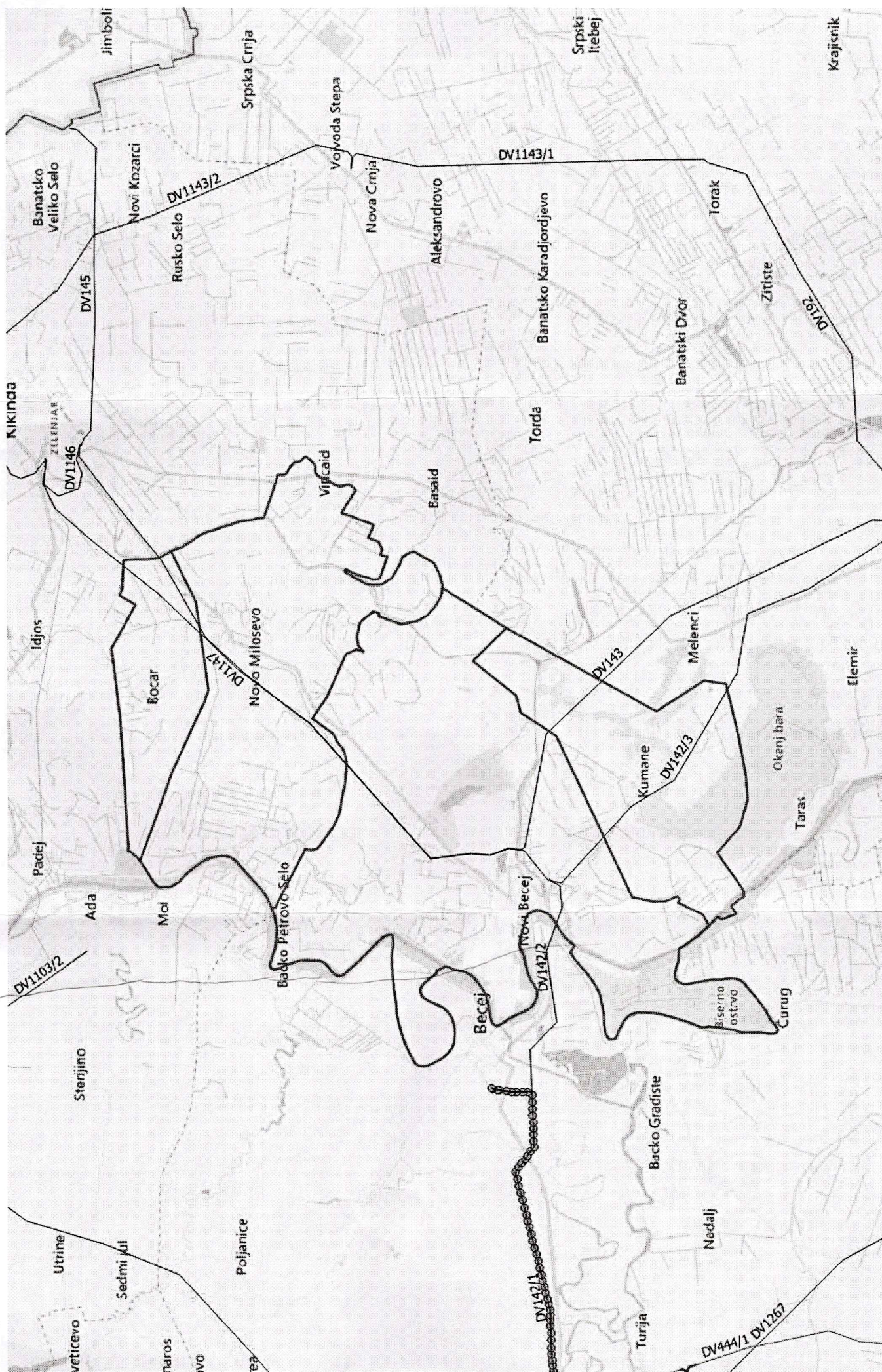
Ортофото 1. Оквирни приказ трасе постојећих далековада